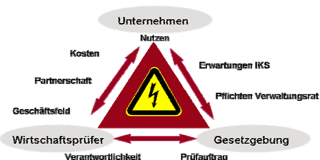
Abbildung: Spannungsfeld IKS

Im Rahmen von IKS-Projekten muss sichergestellt werden, dass die leider zum aktuellen Zeitpunkt noch nicht klaren minimalen Anforderungen an ein IKS erfüllt sind. Aber gleichzeitig gilt es die Chance zu nutzen, IKS als Teil eines effektiven und effizienten Führungsinstruments zu etablieren. Ein frühzeitiges Angehen der Thematik verhindert eine spätere Abhängigkeit von den Wirtschaftsprüfern.