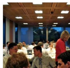
Bilder: Eindrücke der Firmenbesuche bei der Post in Zürich-Mülligen sowie bei der Roche in Basel.